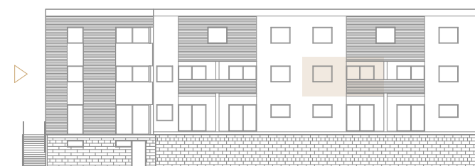
Pozice v rámci budovy