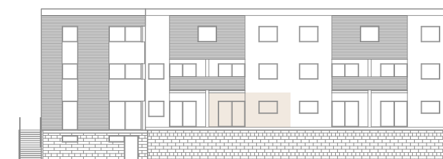
Pozice v rámci budovy