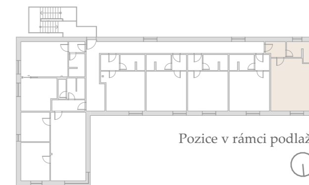
Pozice v rámci podlaží

Podlahová plocha jednotky je vypočtena dle vyhlášky č. 366/2013 Sb., v platném znění. Umístění vyobrazeného zařízení v plánech je pouze orientační, avšak nábytek i vybavení je součástí kupní ceny a odpovídá fotodokumentaci. Fotodokumentace jednotky je přílohou budoucí kupní smlouvy a je její nedílnou součástí. Upřesněné parametry jsou specifikovány v příslušné smluvní dokumentaci s popisem technického stavu odpovídajícího stáří domu. Developer si vyhrazuje právo na drobné úpravy a odchylky mezi stávajícím stavem a dispozičním plánkem jednotky. Případná změna dispozice nebo materiálů podléhá splnění obecně závazných stavebních a právních předpisů.