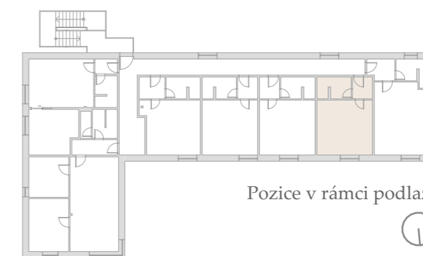
Pozice v rámci podlaží

Podlahová plocha jednotky je vypočtena dle vyhlášky č. 366/2013 Sb., v platném znění. Umístění vyobrazeného zařízení v plánech je pouze orientační, avšak nábytek i vybavení je součástí kupní ceny a odpovídá fotodokumentaci. Fotodokumentace jednotky je přílohou budoucí kupní smlouvy a je její nedílnou součástí. Upřesněné parametry jsou specifikovány v příslušné smluvní dokumentaci s popisem technického stavu odpovídajícího stáří domu. Developer si vyhrazuje právo na drobné úpravy a odchylky mezi stávajícím stavem a dispozičním plánkem jednotky. Případná změna dispozice nebo materiálů podléhá splnění obecně závazných stavebních a právních předpisů.