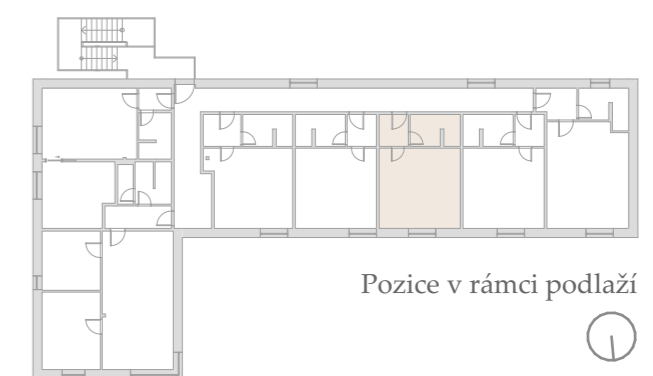
Pozice v rámci podlaží

Podlahová plocha jednotky je vypočtena dle vyhlášky č. 366/2013 Sb., v platném znění. Umístění vyobrazeného zařízení v plánech je pouze orientační, avšak nábytek i vybavení je součástí kupní ceny a odpovídá fotodokumentaci. Fotodokumentace jednotky je přílohou budoucí kupní smlouvy a je její nedílnou součástí. Upřesněné parametry jsou specifikovány v příslušné smluvní dokumentaci s popisem technického stavu odpovídajícího stáří domu. Developer si vyhrazuje právo na drobné úpravy a odchylky mezi stávajícím stavem a dispozičním plánkem jednotky. Případná změna dispozice nebo materiálů podléhá splnění obecně závazných stavebních a právních předpisů.